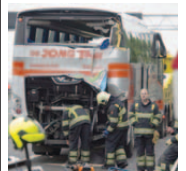
Un des bus accidentés.

Trois autocars ont été impliqués dans un accident samedi sur une autoroute des Pays-Bas, faisant plus d'une trentaine de blessés, dont deux grièvement touchés, a-t-on appris de source policière. L'accident a eu lieu près de la petite ville de Muiden, à une dizaine de kilomètres au sud-est d'Amsterdam.