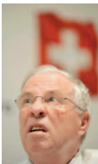
Christoph Blocher n'attire pas les foules.

«L'Expérience Blocher», le documentaire de Jean-Stéphane Bron sur le tribun de l'UDC, est un flop dans les salles alémaniques. Moins de 6000 spectateurs sont allés le voir pendant ses deux premières semaines outre-Sarine, selon les chiffres de l'association ProCinema publiés également par «Le Matin hier». Autant de personnes l'avaient visionné lors de son avant-première sur la Piazza Grande au Festival de Locarno cet été. Les applaudissements s'étaient déjà montrés réservés et les critiques dures. En Suisse romande, le film est sorti mercredi. Les premiers chiffres de fréquentation seront connus la semaine prochaine. ATS