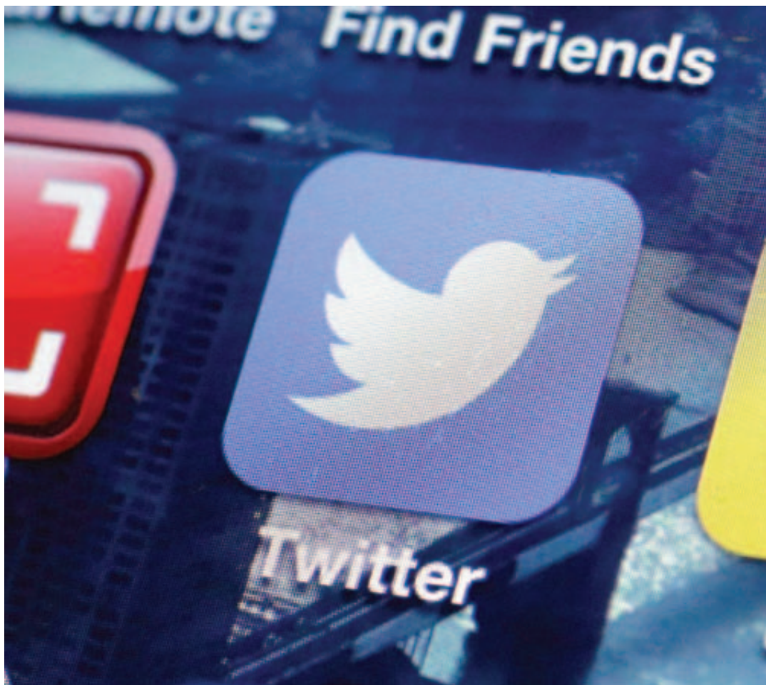
Twitter est devenu le réseau social le plus apprécié des adolescents par sa légèreté et son efficacité.

Les opposants en Turquie aiment Twitter «parce qu'il est lé-